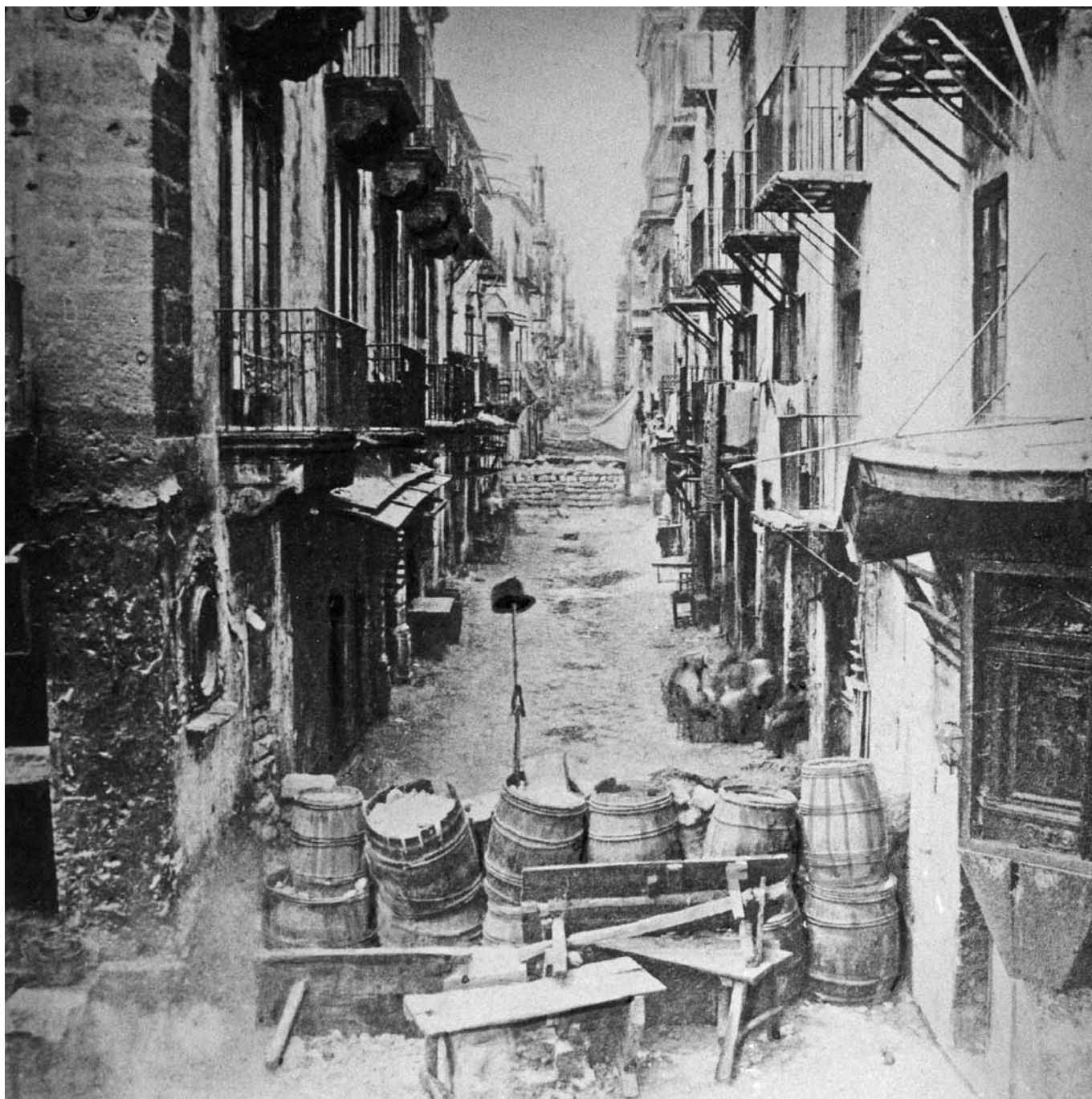
■ Barricate allestite per le vie di Palermo da "picciotti" e garibaldini. In questa è stato issato il cappello del capo della polizia borbonica.