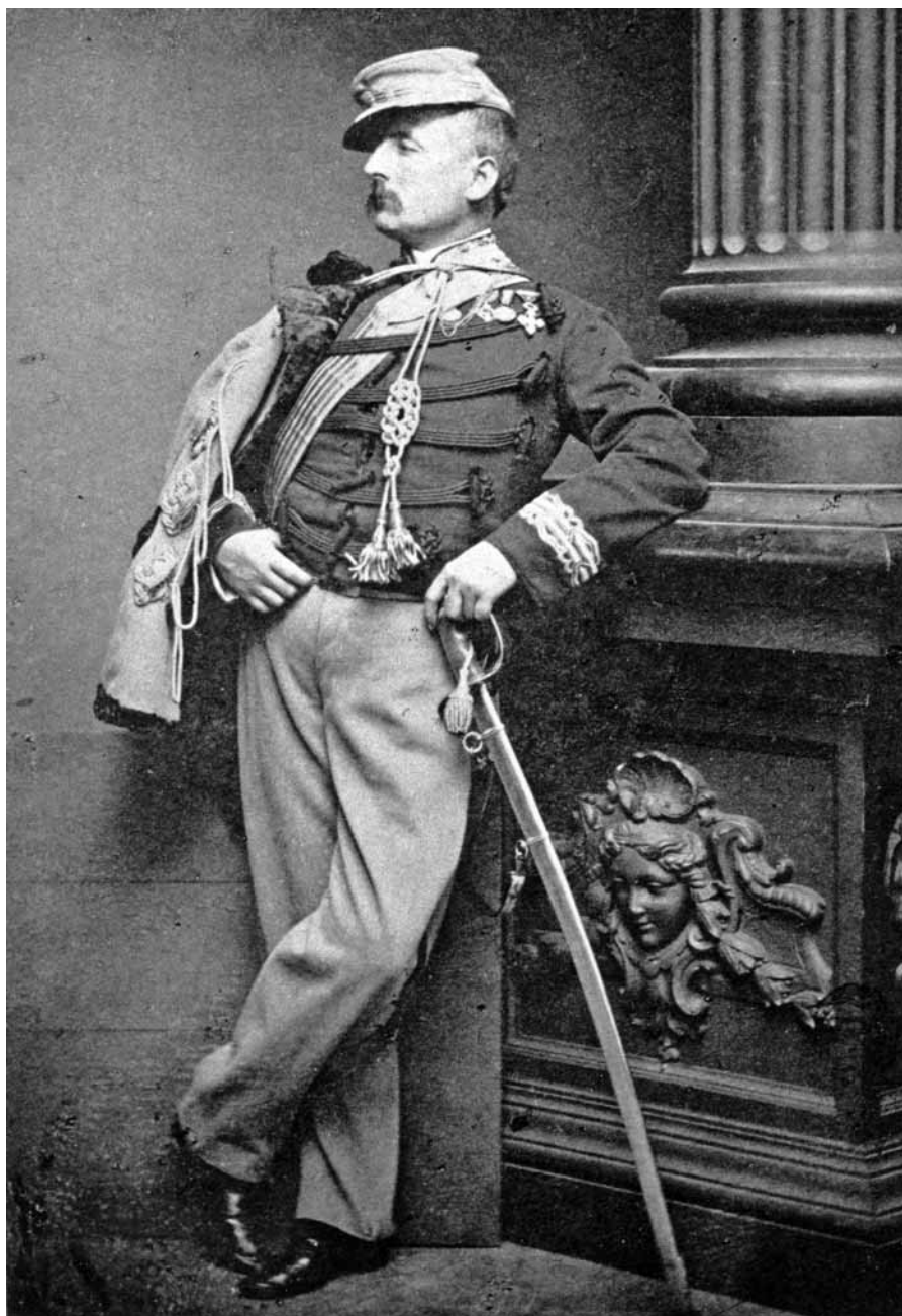
■ Nino Bixio nella divisa da generale garibaldino.