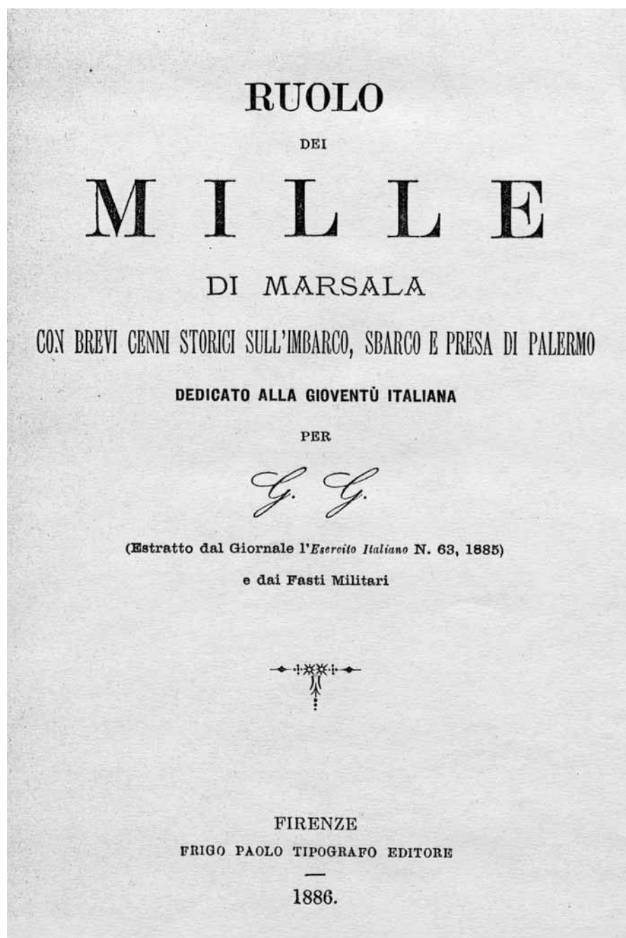
■ Da questo "ruolino" stampato a Firenze nel 1886, abbiamo ripreso tutto l'elenco dei Mille.