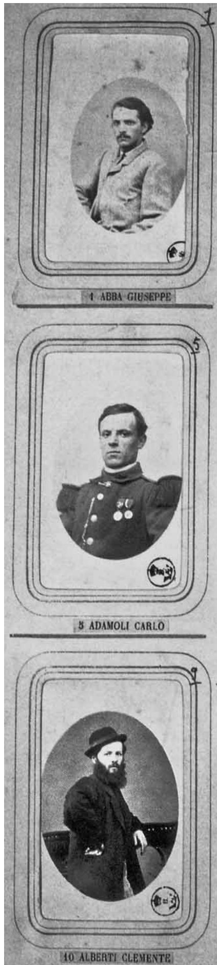
■ Qui e nelle immagini seguenti fotoritratti di alcuni garibaldini che parteciparono alla spedizione dei Mille, fotografati da Alessandro Pavia.