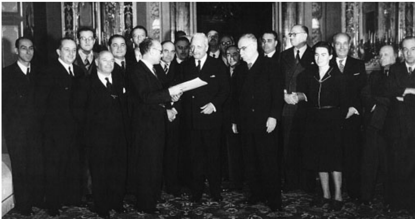
■ Roma, 27 dicembre 1947. Il Comitato dei 18 consegna il testo della Carta Costituzionale al Capo provvisorio dello Stato, De Nicola.

Questo, sia chiaro, non ha nulla a che vedere con i rafforzamenti, più che possibili ed opportuni, dei poteri del premier in un sistema parlamentare, dal conferimento solo a lui della fiducia parlamentare (che è ben diversa dalla fiducia presunta della riforma in discussione), alla conseguente scelta da parte sua dei ministri, al potere stesso di revocarli, sino alla facoltà di chiedere lo scioglimento, che solo a determinate condizioni il Capo dello Stato può non concedergli.