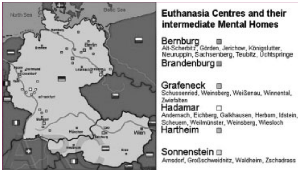
■ Mappa dei campi dove si praticava l'eutanasia.

nota 7), ma come affrontare il presente ed il futuro.