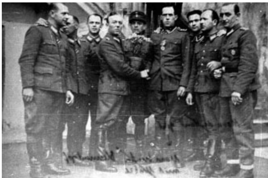
■ Soldati e ufficiali nazisti, membri del programma T4.

denburg fu il prototipo di tutte le altre camere a gas fisse. Rimaneva però il problema dello smaltimento dei cadaveri: dopo averli profanati, se avevano una qualche utilità commerciale (denti d'oro o altro), venivano posti su una lastra di metallo che veniva infilata in un forno crematorio per essere ridotti in cenere. Chiunque faceva parte di questo programma era convinto che la gassificazione era il modo più rapido e umano per liberare i pazienti dai loro mali e sofferenze. Come tutte le scelleratezze umane, oltre ad un manto di legalità e perbenismo, queste uccisioni dovevano rimanere segrete. Fu istituito un sistema burocratico "alla tedesca", estremamente efficiente che produceva cartelle cliniche false, certificati di morte fraudolenti, e false lettere ai parenti delle vittime, tutto con lo scopo di nascondere che cosa si stava facendo. Questi medici assassini erano così orgogliosi del loro lavoro che al centro di Hadamar, il più efficiente, la Direzione organizzò, all'inizio del 1941, una cerimonia speciale per il raggiungimento della decimillesima vittima. Quando il cadavere n. 10.000 si trovò sulla lastra di metallo pronto a essere infilato nel forno crematorio, circondato dai fiori, il Direttore e il Sovrintendente del centro tennero un discorso e premiarono i loro collaboratori con birra a volontà. Il programma di eutanasia andò avanti, anche se Hitler formalmen-