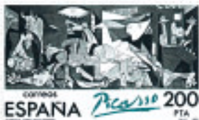
Francobolli, spagnolo e cecoslovacco, dedicati a Guernica di Picasso.