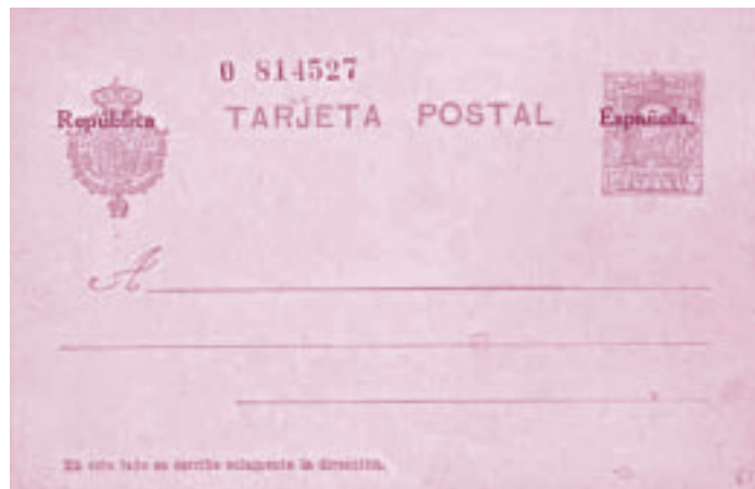
Cartolina postale della Repubblica Spagnola.

a cura del CIFR Centro Italiano Filatelia Resistenza