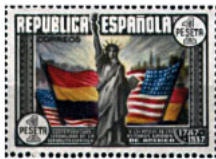
Valore della Repubblica Spagnola.

Le ripercussioni politiche ed emotive della guerra andarono ben oltre i confini della nazione. A seconda dei punti di vista è stata