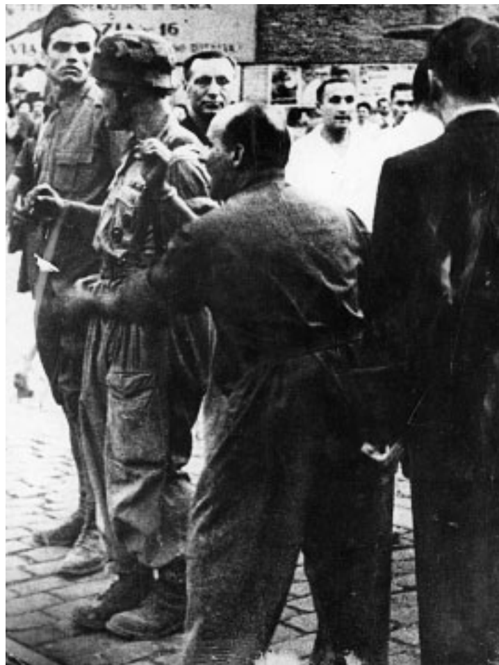
■ Il generale americano Taylor che coordinerà le truppe italiane dopo l'8 settembre. A lato, Roma 8 settembre '43: un paracadutista tedesco viene catturato dagli artiglieri a Porta San Paolo.

di Marzabotto. Non bisogna dimenticare ancora la strage delle Fosse Ardeatine. Complici di tutti questi episodi furono gli stessi fascisti, come osservatori passivi e a volte come partecipanti attivi.