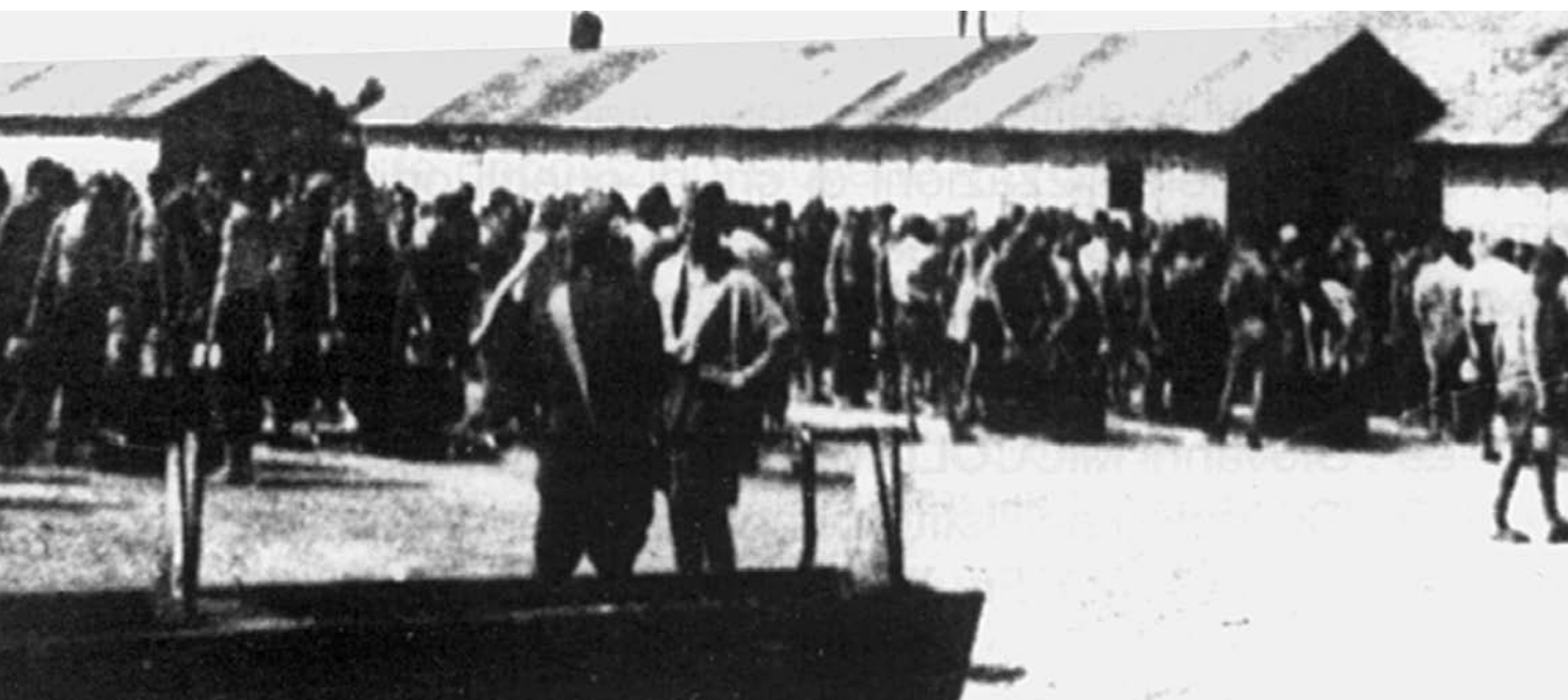
■ Campo di concentramento n. 89 per jugoslavi in Gonars (Udine) operante dal '41 al '43: conta dei prigionieri.

Voglio citare, tanto per far capire qual è il livello di varietà di situazioni che si potevano verificare all'epoca, che l'infoibamento più consistente del maggio 1945 della zona di Trieste, è quello dei 18 gettati nell'abisso Plutone, eccidio che fu operato da una banda di criminali comuni che si erano infiltrati nel movimento partigiano. Quindi anche qui abbiamo un ulteriore, diver-