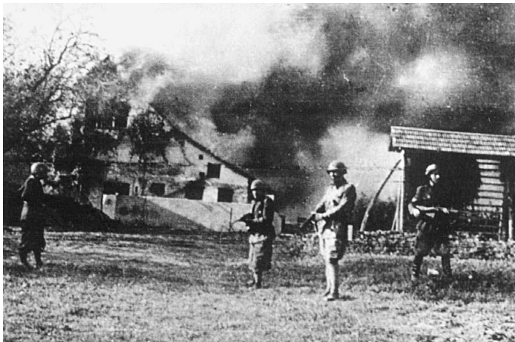
■ Dove passano, soldati e camicie nere italiani bruciano i paesi sloveni, seminando morte tra le popolazioni.