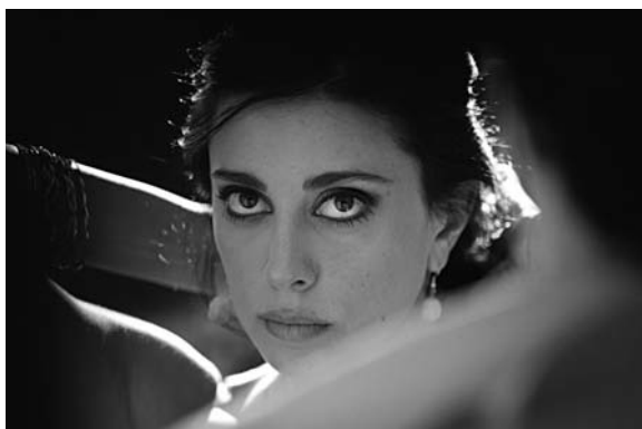
■ La protagonista di "Caramel" e, sopra, alcune scene del film.

poliziotto, sottoposto alle affettuose torture del caramello per un nuovo look gratuito. Ci colpisce l'intensa raffigurazione della simpatia, tra Rima e la cliente. Il feeling appena intuito si risolve in sequenze essenziali di pura bellezza, nella gestualità del lavaggio. Eloquente sarà anche l'immagine di quest'ultima con i capelli corvini