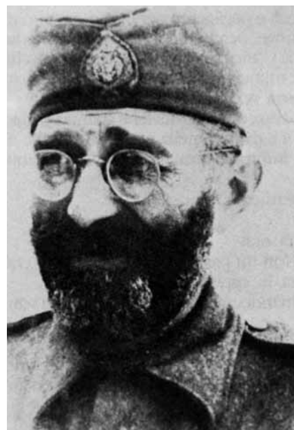
■ Draža Mihajlović, Colonnello dell'Esercito Regio Jugoslavo, capo dei cetnici e rappresentante di Re Pietro (esule a Londra dopo la capitolazione della Jugoslavia nell'aprile 1941).

Il primo giorno no, ma il secondo la fame mi divorava. Mi presentai a un paesino di poche case e fui accolto. Mi diedero da mangiare e la mattina fui accompagnato da due staffette in un altro paese e poi il giorno dopo in un altro paese ancora. Poi mi portarono in un'abetina dove c'erano due segherie, a lavorare per guadagnarmi il pane che mi davano. A queste segherie ci sono stato da maggio fino a set-