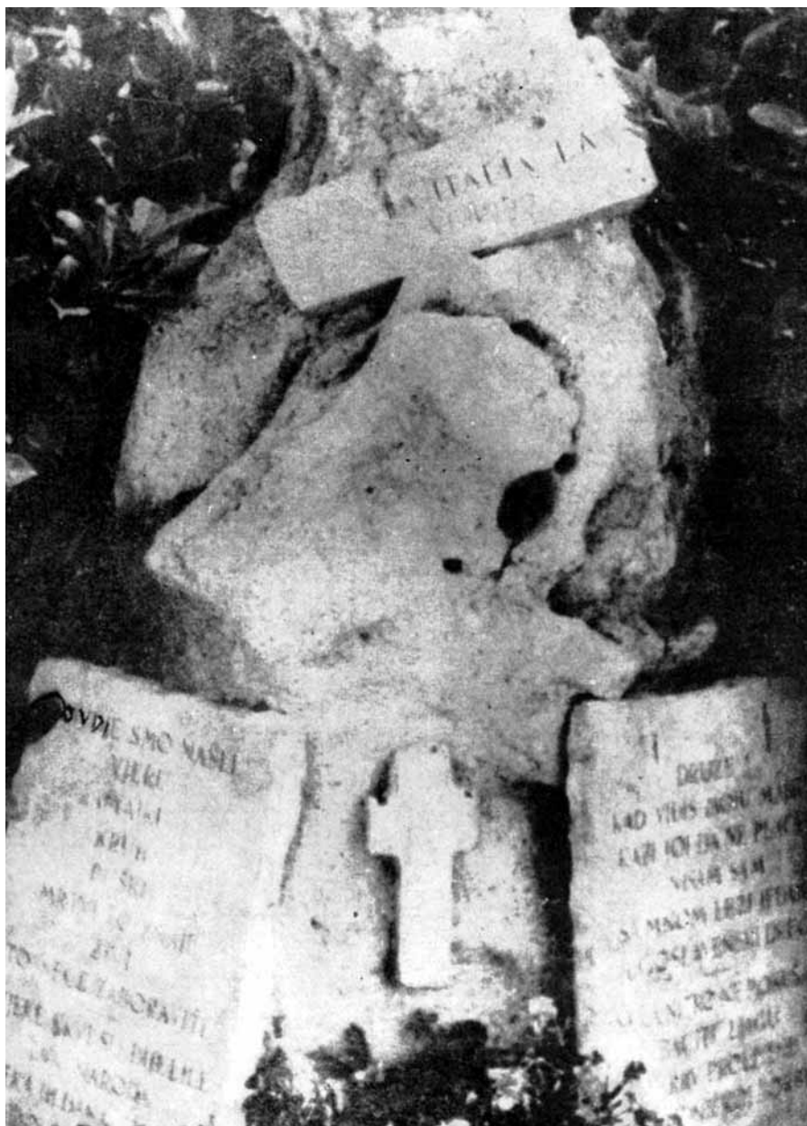
■ Il cippo del cimitero di Zagabria che accoglie le salme dei Caduti della Brigata "Italia".