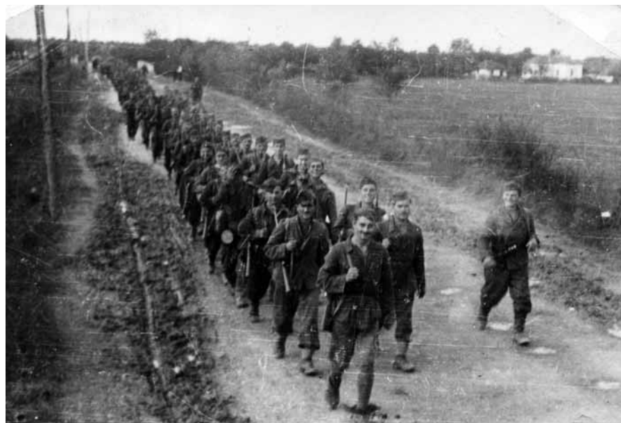
■ Un reparto della Divisione "Italia" in Jugoslavia.