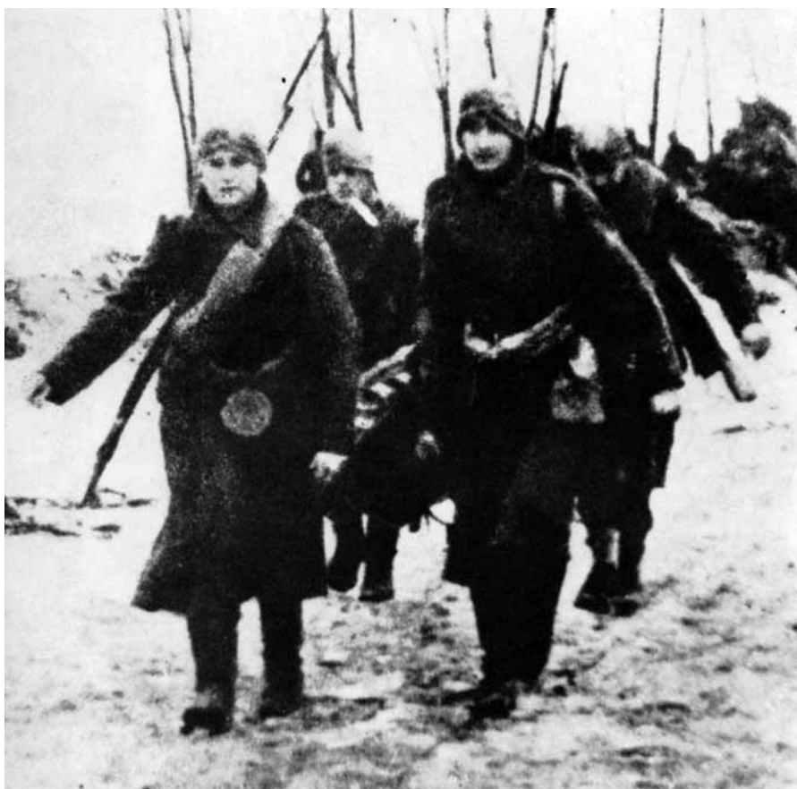
■ Trasporto di feriti nelle retrovie del fronte dello Srem.

L'11 attraversammo i campi minati e io posso raccontare questo: quel giorno li ebbi paura. Vedevo saltare in aria i nostri soldati, uno dopo quell'altro. Allora che cosa feci? Presi un ferito sulle spalle e me lo riportai nel camminamento e cercai di portarlo indietro, anche