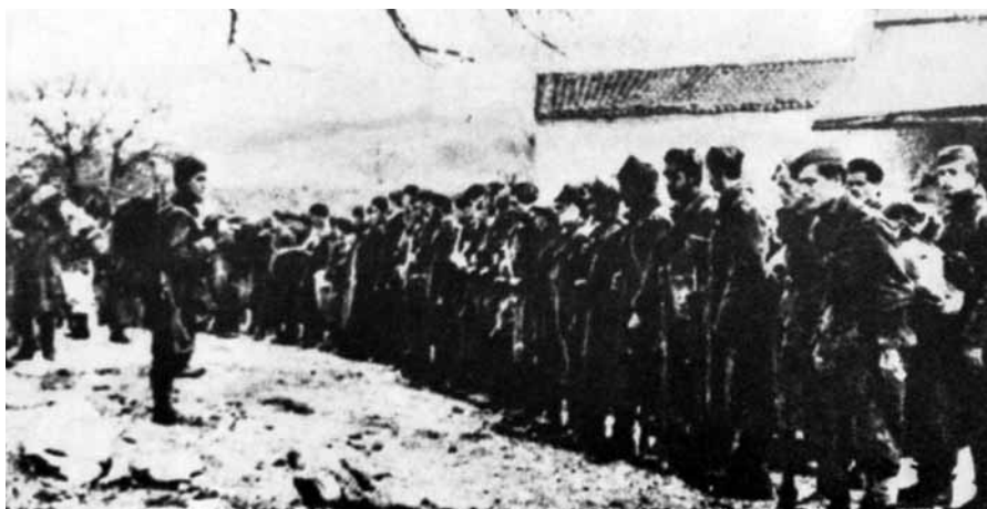
■ Un battaglione della Brigata "Italia" in partenza sul fronte dello Srem.

Rimasi con loro fino al 20 di dicembre. Quel giorno ero via dal comando, come sempre andavo a un distaccamento ad accomodare una Breda, ero con una staffetta e