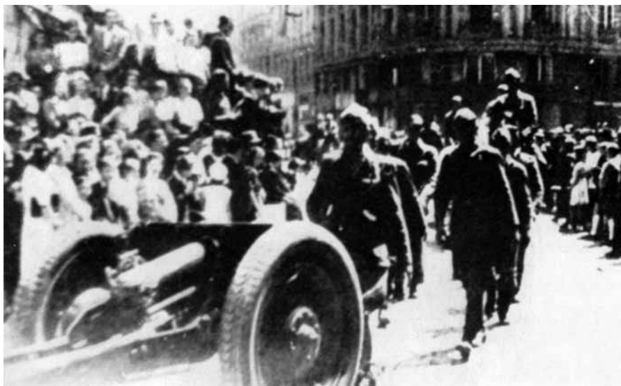
■ Unità partigiane entrano a Zagabria l'8 maggio 1945.

Ormai era proprio buio. Al posto di blocco c'erano già 3 o 4 soldati dei nostri che aspettavano. Quando fu quasi mezzanotte passò un