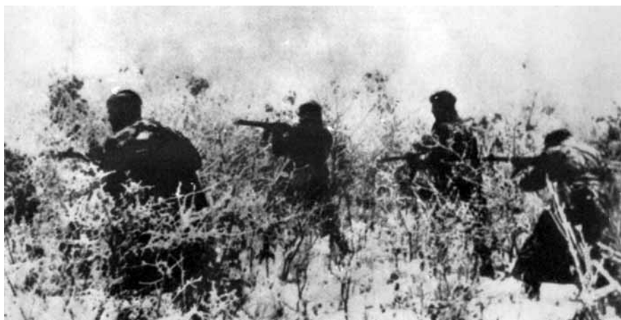
■ Una pattuglia della Brigata "Italia" in esplorazione sul fronte dello Srem nel marzo 1945.