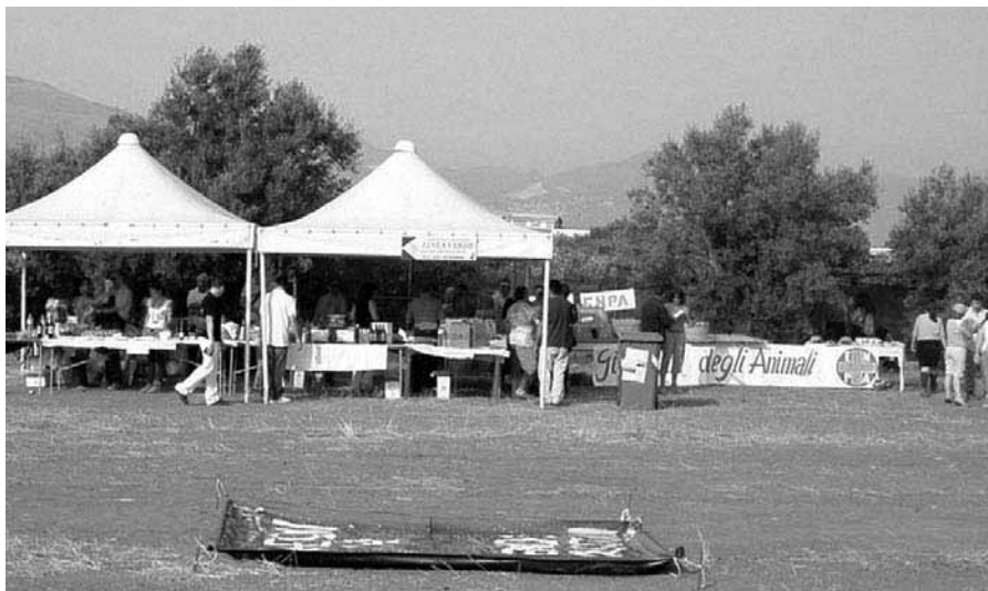
■ Contrada San Giuseppe - Partinico. Una iniziativa promossa da LiberaMente, sui terreni confiscati alla mafia.

nalità nobilissima quella della lotta alla criminalità – disse – hanno il gravoso e meritorio compito di tenere desta l'attenzione dell'opinione pubblica, affinché dietro il paravento della cosiddetta "normalizzazione" non si pervenga invece ad una frettolosa "smobilitazione" dell'apparato antimafia e coloro che, doverosamente e dolorosamente, hanno ritenuto in questa lotta di trovarsi in prima fila non vengano addirittura additati, come recentemente è avvenuto, alla pubblica esecrazione. Si deve rifiutare il concetto di emergenza nella lotta alla criminalità mafiosa e vanno ritenuti privi di significato valido i costanti richiami alla normalizzazione».