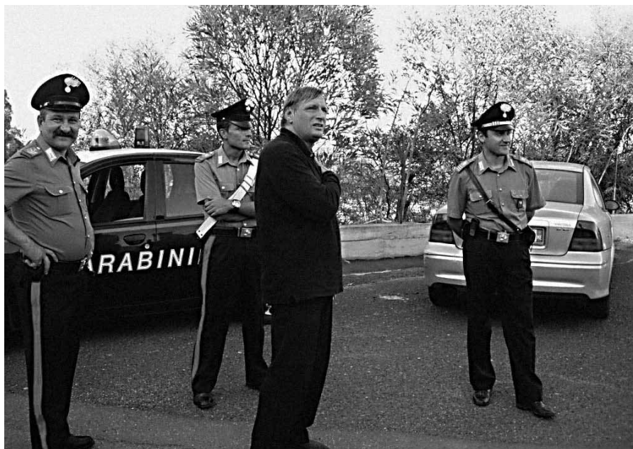
■ Don Ciotti con la scorta.

All'epoca, nel panorama della criminalità organizzata nazionale, spiccava Cosa Nostra, entrata in crisi con gli importanti arresti degli ultimi tempi. Oggi l'organizzazione più potente è la 'ndrangheta. Per quanto riguarda la camorra ed i gruppi pugliesi basta leggere giornalmente le notizie di cronaca. Ma ciò che più inquieta è la "ramificazione territoriale" delle quattro malepiante nelle regioni del Centro-Nord, denunciata a chiare lettere dal dottor Piero Grasso proprio nel momento in cui ha lasciato la