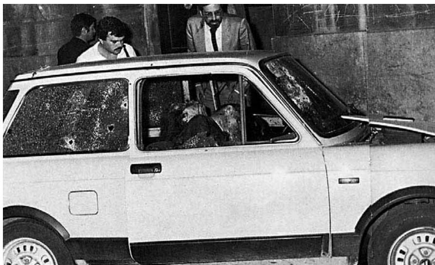
■ I corpi del gen. Dalla Chiesa e della moglie Emanuela Setti Carraro uccisi dalla mafia nel 1982.

L'impegno degli onesti - La frase scritta in Via Carini sul luogo della strage, «Qui è morta la speranza dei palermitani onesti», fu