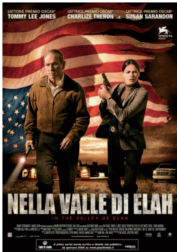
■ La locandina del film.

plina, che ha resistito anche al Vietnam, dovrà soccombere al peso della tragica verità che lo colpisce da vicino.