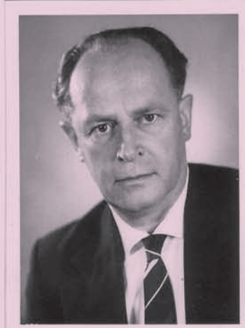
ca 50 Jahre