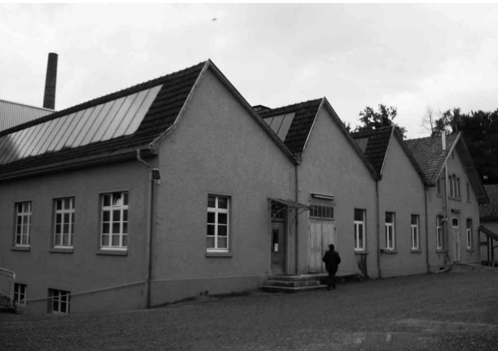
■ La fabbrica come è oggi.