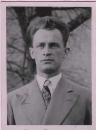
ca 20 Jahre