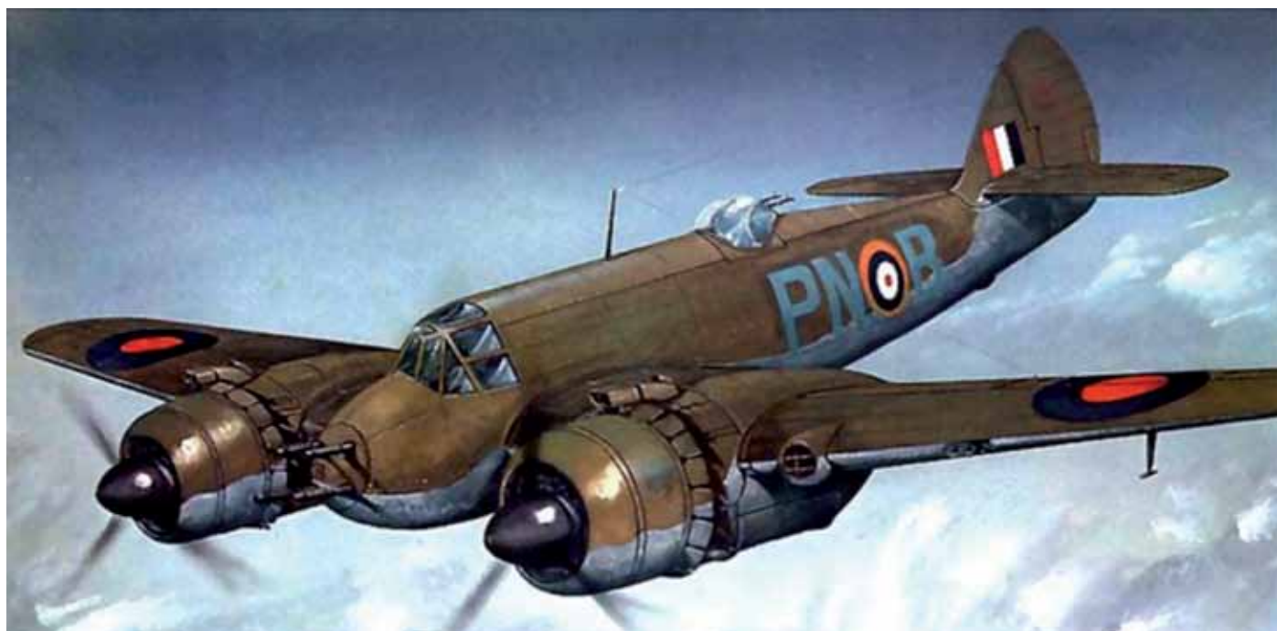
Il cacciabombardiere chiamato "Pippo" in un'immagine dell'epoca