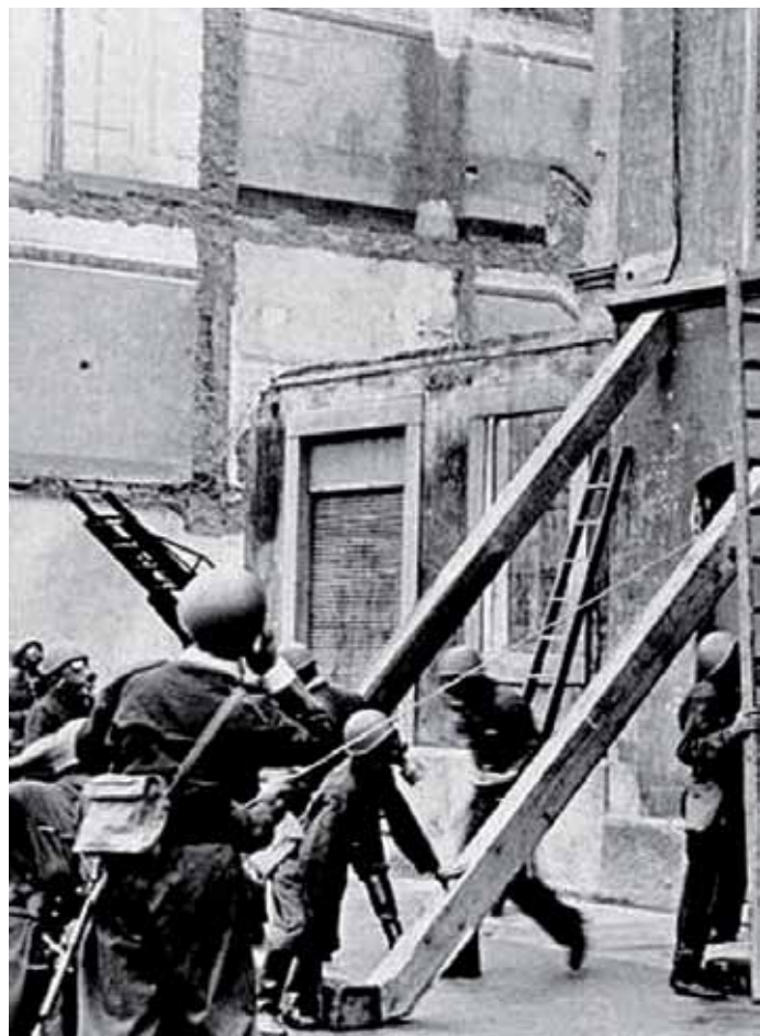
La messa in sicurezza di un palazzo dopo un bombardamento e il dell'Unpa, l'organizzazione