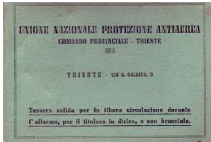
Un lasciapassare per circolare durante l'allarme aereo