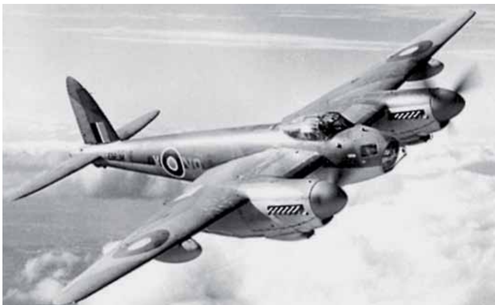
Aereo inglese da bombardamento della Seconda guerra mondiale

chio non furono una prerogativa nazionale, ogni fronte di guerra aveva il suo, con relativo nomignolo: gli internati militari italiani a Francoforte sul Meno lo chiamavano «Martino»; l'aereo giapponese che sorvolava Guadalcanal era detto dagli americani «Washing Machine Charlie» o anche «Millimeter Mike», mentre i piloti americani in Italia lo chiamavano «Bed-Cheek Charlie», stesso nome adottato durante la guerra di Corea.