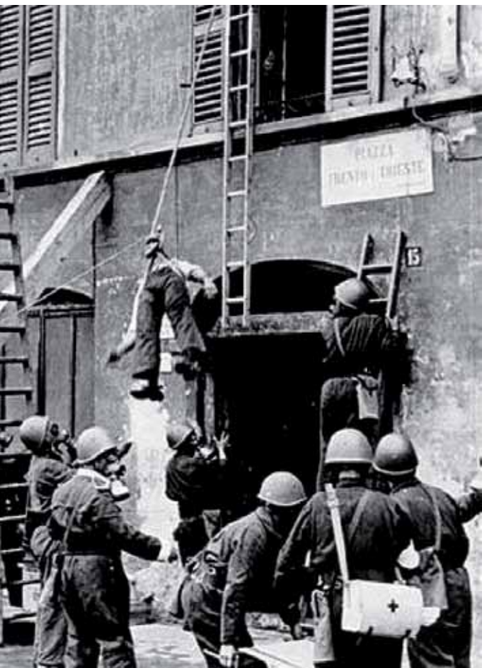
recupero delle vittime. Si tratta di una foto propagandistica della protezione antiaerea