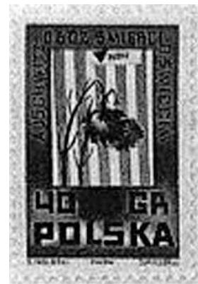
Il francobollo del 1962 dedicato ad Auschwitz per la "Giornata della Memoria". Nella pagina accanto: i vari annulli emessi nel corso degli anni.

parte superiore degli stessi: « È semplicemente inaccettabile negare i fatti storici, soprattutto su un argomento così importante come l'Olocausto. Inoltre è inaccettabile anche chiedere l'eliminazione di uno Stato o di una popolazione. Vorrei che questo principio fondamentale fosse rispettato, sia in retorica che in pratica, da tutti i membri della comunità internazionale ». Scendendo nel dettaglio tecnico dei tre francobolli, di formato orizzonta-