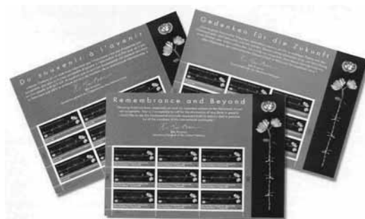
MEMORIA E OLTRE