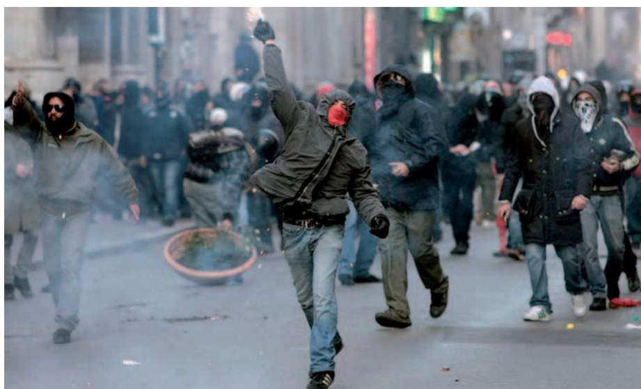
14 dicembre 2010: guerriglia urbana a Roma

le città italiane. Che la violenza di piazza sia dunque diventata lo strumento privilegiato per farsi ascoltare dalle categorie sociali più deboli? E quanto influisce su ciò il fatto che manchino delle forze politiche con spiccata sensibilità su quello che accade nella realtà del Paese e quindi interpretarlo e portarlo nelle sedi deputate facendo da trait d'union tra il Palazzo e la strada?