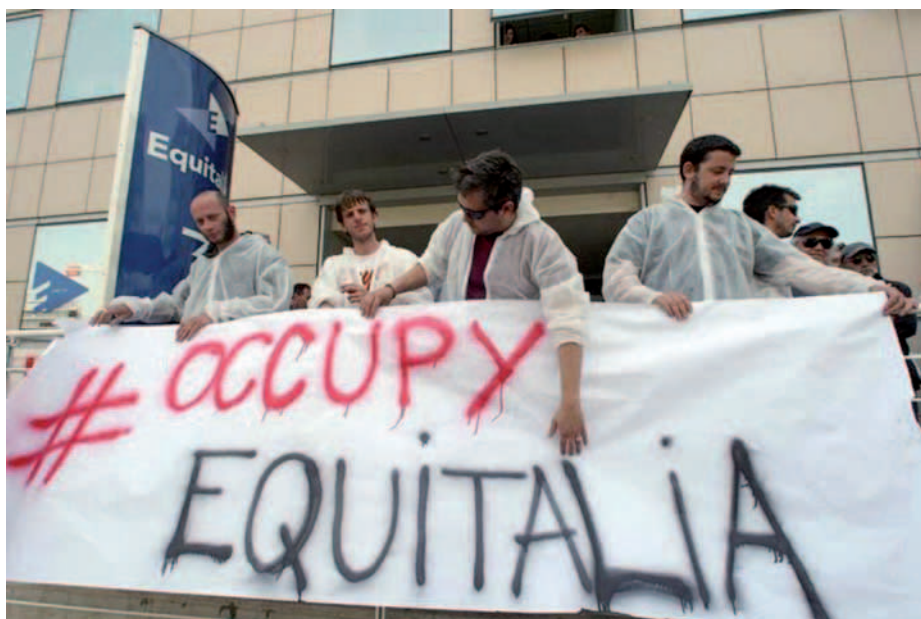
I disobbedienti veneti manifestano davanti ad una sede di Equitalia

Consiglio molto appariscente come il Cavaliere Silvio Berlusconi, ad uno "algido", apparentemente freddo e distaccato, come Mario Monti. È possibile che questo atteggiamento del nuovo premier sia stato inteso da molti come indifferenza ai bisogni del popolo, accrescendo così la rabbia?