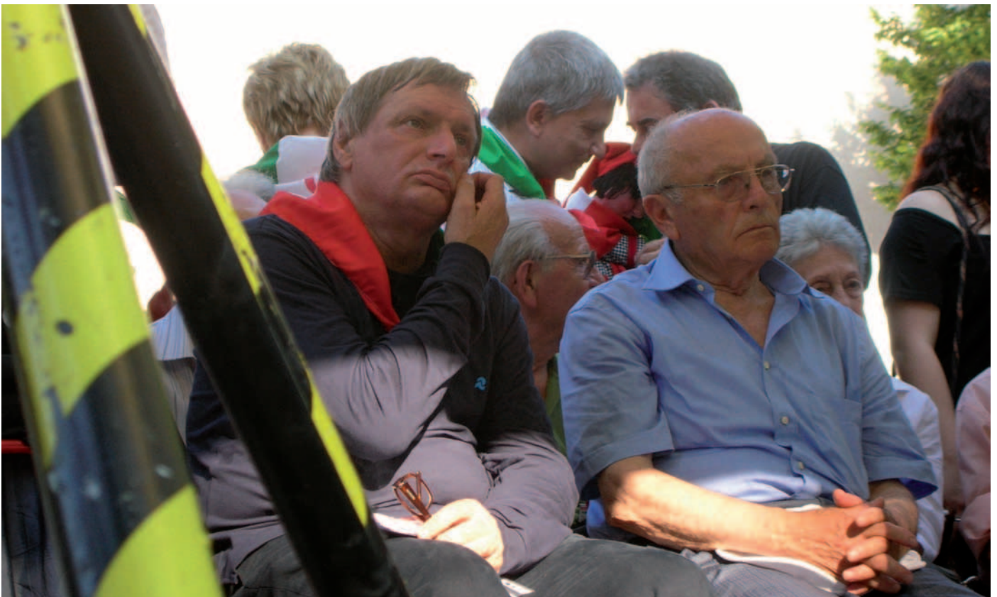
Don Luigi Ciotti sul palco della 1ª Festa nazionale dell'ANPI che si svolse nel suggestivo ambiente del Museo Cervi di Gattatico, nel giugno 2008

D on Luigi Ciotti non è solo il fondatore del Gruppo Abele. Da sempre, per la sua opera, nel mirino della mafia, l'ideatore di Libera, lavora per contrastare il disagio sociale e tutte le sue sfaccettature. L'abbiamo incontrato nei giorni successivi all'attentato di Genova, in cui è stato gambizzato il dirigente dell'Ansaldo Roberto Adinolfi. Tutto questo