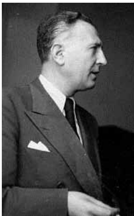
Randolfo Pacciardi, esponente del Partito Repubblicano

Come si vede, nell'appello di Barbera, Panebianco, Parisi e Segni si sostiene che il rigetto della politica è causato (“per questo...”) da un sistema di governo debole consegnatoci dalla Costituzione; dunque è nella Carta la radice del problema. Dalle