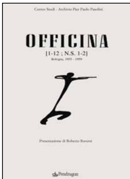
La copertina della rivista

poi è arrivato un aprile sangue di sole e di rose come un vulcano che esplode ha gridato libertà