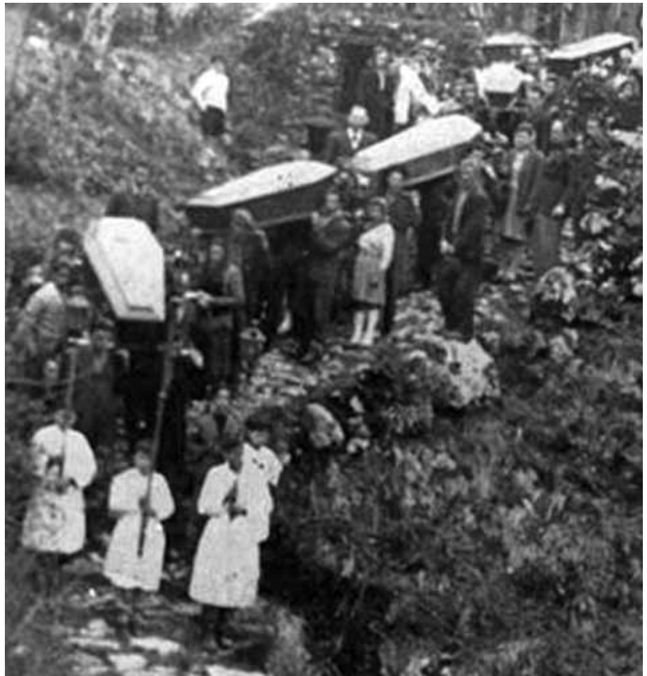
La traslazione dei resti delle vittime della strage di S. Anna di Stazzema verso il Monumento Ossario, avvenuta nella primavera del 1948

La ricostruzione giudiziale dei crimini nazifascisti in Italia. Questioni preliminari , pubblicato dall'editore Giappichelli di Torino, costituisce un primo passo di analisi su un fenomeno giudiziario su cui la comunità scientifica si è poco o per nulla occupata. Il lavoro prende le mosse da una necessità: stabilire un baricentro a questa peculiare esperienza di giustizia, analizzando alcune sue specifiche caratteristiche, la centralità della narrazione da parte delle vittime e il rapporto tra investigazione giudiziaria e ostacoli frapposti alla stessa. Tra le pieghe di un processo, oltre alle problematiche di ordine giuridico, spesso si nascondono chiavi di