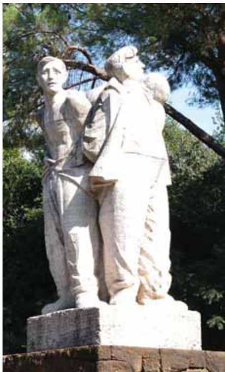
Il Monumento ai Martiri delle Fosse Ardeatine

Dunque, in sintesi, l'esperienza giudiziaria militare interna è giunta con grande fatica a fornire delle risposte e a stabilire responsabilità e importanti principi di civiltà giuridica. Gli interventi giudiziari internazionali successivi (o i non intervenuti nel caso dell'esecuzione delle condanne) suggeriscono, da un lato, la prevalenza dello scudo protettivo rappresentato dall'immunità dello Stato – nel caso specifico la Repubblica Federale di Germania – rispetto alla Giustizia; dall'altro, il primato della volontà politica. Un campo assai complesso in cui l'avvocato di parte civile non ha potuto avere più voce in capitolo.