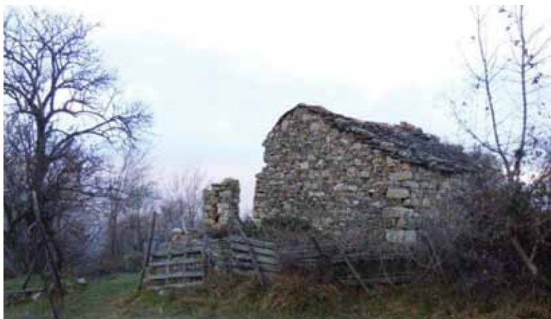
Casone nella zona del "Passu du Beu"