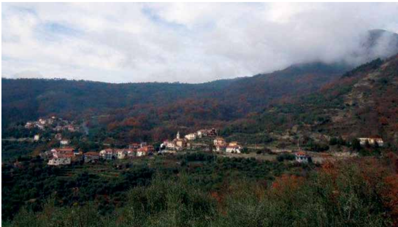
Curenna, Borgo e Monte Castellermo, coperto dalle nubi