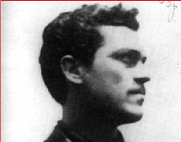
Felice Cascione “u megu”, il medico partigiano

La Notte di Natale del 1943 gli abitanti della frazione Curenna del Comune di Vendone , uscendo dalla messa di mezzanotte, avranno la sorpresa di trovare il gruppo dei partigiani armati sul sagrato della