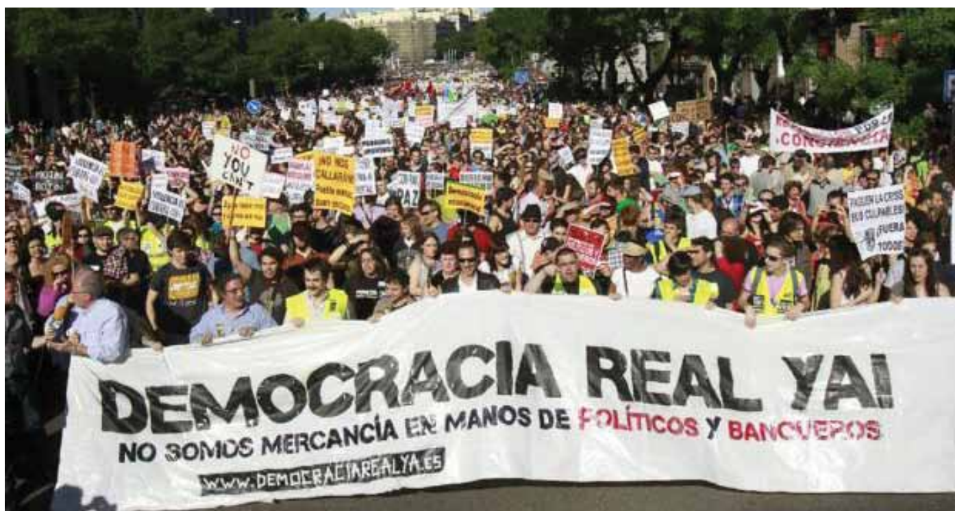
Un corteo degli indignados a Madrid