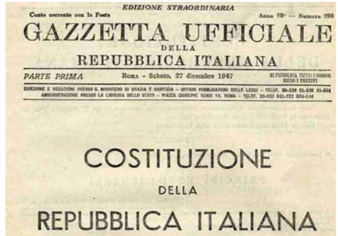
La Gazzetta Ufficiale del 27 dicembre 1947 con il testo integrale della Costituzione

rio» 12 . Revelli conferma, quando descrive «l'inoperosità della politica intesa come azione razionalmente orientata alla soluzione dei problemi sociali» 13 . Analizzando le ragioni di questo distacco sempre più traumatico, Piero Ignazi sostiene che «da ponti fra società e Stato, i partiti sono "entrati" sempre più dentro lo Stato, diventandone quasi delle agenzie. I partiti si sono incistati nello Stato, sono diventati "Stato-centrici". Fanno parte dello Stato. Lo usano e lo sfruttano. Per vivere e prosperare»; «il processo di accentrimento e verticalizzazione del potere si è accentuato al punto di poter parlare di una tendenza generale alla presidenzializzazione dei partiti» 14 .