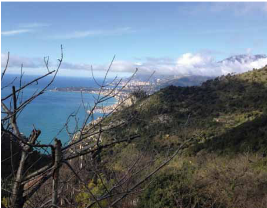
Il panorama dal Passo verso la Francia

te il fascismo vere e proprie organizzazioni criminali, che contattavano la povera gente del Sud, illudendola con promesse di ricchezza e riscatto. Depredavano i malcapitati del poco che avevano e poi spesso li abbandonavano a se stessi oltrefrontiera, e intimavano loro il silenzio minacciandoli di morte. Si ha notizia di una importante azione repressiva del 1924 da parte della polizia francese. Fatti che hanno evidenti affinità con il traffico di esseri umani dei tempi nostri.