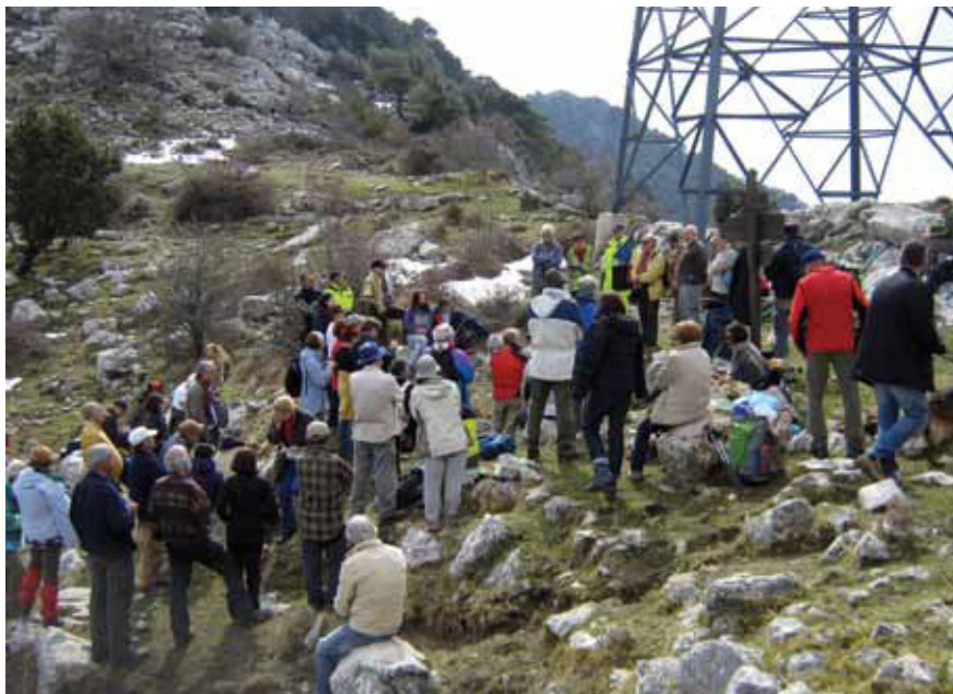
Il gruppo che ha partecipato alla manifestazione "passi per ricordare" all'arrivo, sotto il grande traliccio del Passo del Cornà

quello dal piccolo borgo di Olivetta San Michele al Passo Treittore, e quello dalla località Ciotti al Passo del Cornà. Si tratta di sentieri praticabili, e piuttosto praticati infatti dagli appassionati della montagna e del trekking. Si procede dapprima fra campi coltivati e olivi, poi nella profumata vegetazione mediterranea, fino ad ambienti tipicamente alpini. L'ascesa da circa 300 a oltre 1.000 metri di altezza offre l'emozione di una vista mozzafiato, dalla Costa Azzurra alle montagne del Piemonte, fino a Bordighera. All'inizio di entrambi gli itinerari erano stati posti dei cartelli esplicativi, ma già sono deteriorati. Un peccato che non si possa piuttosto recuperare altri percorsi, renderli fruibili, pubblicizzarli, portarci le scolaresche, far entrare insomma a pieno titolo questi luoghi di memoria nella consapevolezza delle comunità. A spingere in questa direzione la manife-